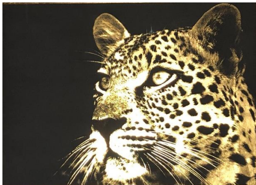
Jean-Philippe Rigotti : Force tranquille Gravure originale sur Or 23,6 carats, technique exclusive de l'artiste, 84 x 70 cm, 2019

C'est une technique exclusive de l'Artiste, qui aujourd'hui encore est le seul au monde à proposer un réel travail en trois dimensions sur feuilles d'Or.