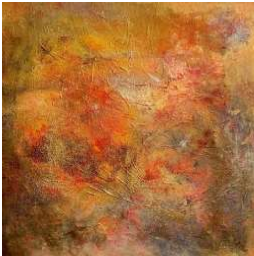
«PARFUM», 100 x 100 cm

Gerne stelle ich Ihnen anlässlich der ART International Zürich 2020 exklusiv eines meiner neusten Kunstwerke vor: