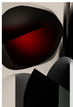
Rosso di luna