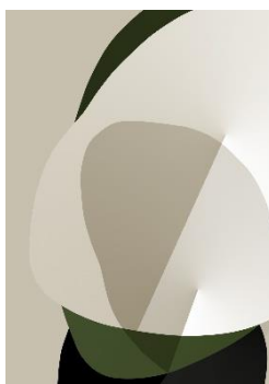
In equilibrio sul nulla

Die "Expo Arte" in São Paulo ist eine wichtige Plattform für internationale Gegenwartskunst. Sie bietet einen interaktiven Treffpunkt für Galeristen, Sammler und ein kunstaffines Publikum. Ausgelesene Kunstwerke aus Südamerika und aus der ganzen Welt werden an der "Expo Arte" vorgestellt.