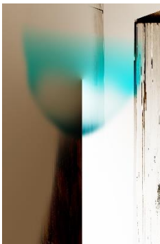
Last shower of champagne