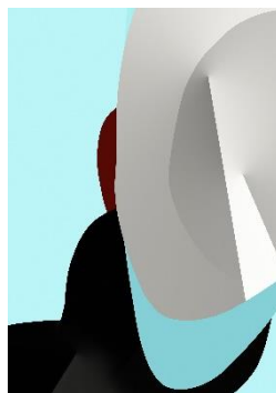
Un sogno color turchese

Marco Jacconi wird vom 1. bis zum 4. Oktober an der "Art International Zurich" acht Werke aus der Reihe "Shapes of the deep" präsentieren. Für die Ausstellung im Puls 5 an der Zürcher Hardbrücke werden jährlich bekannte sowie neue Gegenwartskünstler aus den Bereichen Malerei, Grafik, Skulptur und Fotografie ausgesucht.